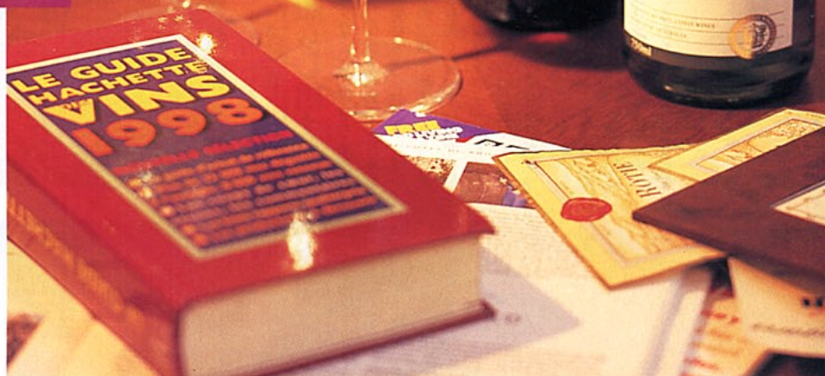
グラス(左) ¥1250、(右) ¥3800

情報にうるさく、好奇心の旺盛な双子座は、いったんハマると、集中的にその世界に突入してゆきます。ついこの間まで「ワインなんて味はどうでもいい」と思っていたのに、今では「産地が、ブドウの品種が...」なんていっぱしの通気取り、なんてことも。そんなあなたを幸せに導くワインの飲み方とは、ワインのハンドブックを片手に、順次いろんなタイプを試していくという方法。 ただ、味の好みとしては、あまり重いものはタイプではないかもしれません。気軽に飲めるライトなものから始めてゆく、というのがおすすめかも。白ワインも好みかも知れません。