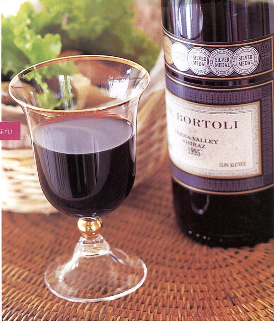
ランチョンマット ¥1600 C バスケット ¥300 A グラス ¥3400 B

てみて。意外に安くておいしいワインが発見できるかもしれません。エスニック料理にワインという取り合わせも、あなたにならすんなりとトライできそうです。 また、開放的なところがあなたの長所。公園にサンドイッチを片手に、気軽なテーブルワインをあけて、ちょっとしたピクニック、なんていうのも射手座のあなたらしくて素敵なワインの楽しみ方です。