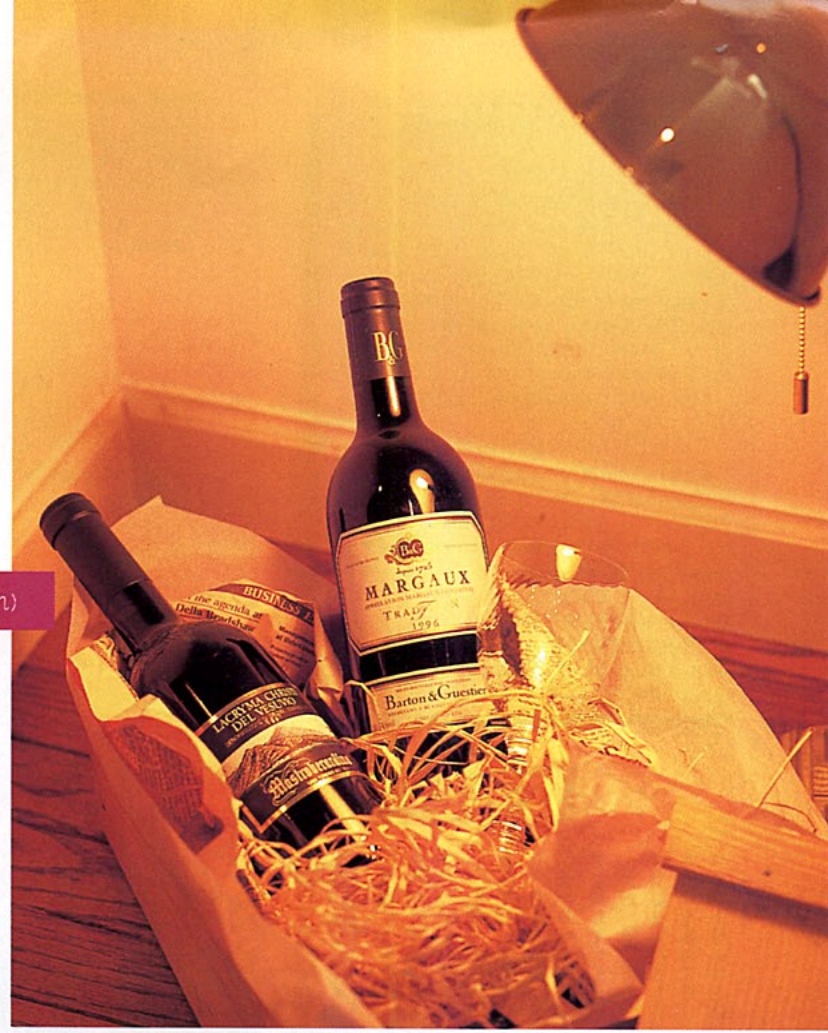
スタンド ¥20000 〇 グラス ¥2700 〇

ドラマチックに豪華に… ワインに私照らし出す ゴージャス 何でもドラマチックなことが好きなあなた。ワインにも、ストーリー性を求めるところがあります。自分の誕生日のワインをプレゼントされたら最も喜ぶのが獅子座でしょう。そういう意味では値段も高くて仕方がないかもしれませんが、「ヘミングウェイが愛していたワイン」とか、自分なりの物語をワインの中に探していくと、幸運への手がかりが見つかるかもしれません。 また、時にはゴージャスなムードで楽しむのでもいいかも。BFと、ちょっと憧れのワインバーに行ってソムリエと相談しながらオーダーする、なんていうのも、特別な日にはぜひおすすめです。