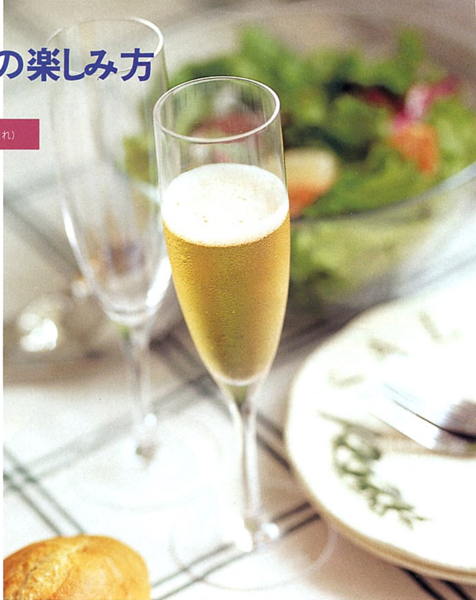
テーブルクロス¥2500、プレート各¥1000、グラス各¥1800/以上A

(右) セグラ ヴューダス社 カヴァブリュット レゼルヴァ (赤) ¥1460R ほどよい酸味、苦味があり、全体的に爽やかな味わいがある。 (左) カンティナ ダネーゼ社 プロセコ ディ ヴァルドッピアデーネ スブマンテ エクストラ ドライ (白) ¥2200G イタリア産。軽めでほんのり甘い。冷やして飲むと、よりおいしさが引き立つ。