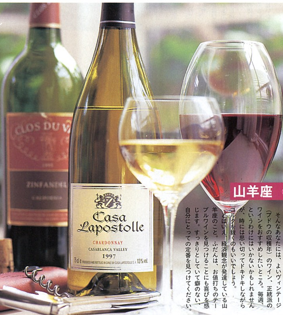
グラス(右) ¥5,000、(左) ¥2,000/以上D ソムリエナイフ ¥2,000、コルク栓 ¥800/以上C

山羊座におすすめのワイン (右) カーサ ラポストール社 シャルドネ(白) ¥2500P 話題のチリ産。果実味たっぷりのワイン、やや甘みがあり、飲みやすい。ワイン初心者におすすめのワイン。(左) クロ・デュ・ヴァル社 ジンファンデル(赤) ¥3300 O ほのかな渋みと酸味が口に広がるワイン。カリフォルニア産。