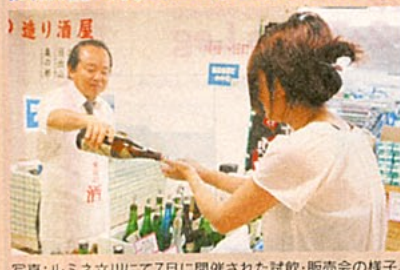
写真：ルミネ立川にて7月に開催された試飲・販売会の様子。

年に3回ルミネ立川で実施される、東京の地酒が数多く試飲できるので、購入することができます。他にも、国営昭和記念公園に10数回、東京の地酒試飲・販売会が実施されています。 ★詳しくは… 東京都酒造組合042-524-3033 http://www.tokyosake.or.jp/