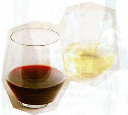
カジュアルな日本の食卓シーンで、日常使いできるワイングラスも登場している