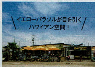
イエローパラソルが目を引く ハワイアン空間！

ハワイノースショアのローカルグルメ。今年の夏、現地ブームの火付け役である「RAY'S」の日本第1号店が鎌倉・由比ガ浜に期間限定でOPENし、日本で一躍有名に！