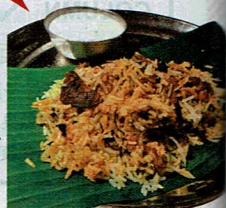
インドの国民食の一つである、 スパイスな炊き込みご飯