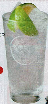
風味豊かな レモン塩を グラスにin