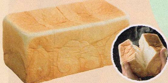
「生」食パンレギュラーサイズ [乃が美]

卵不使用なのにしっとり柔らかく、口の中でほんのり広がる甘さが心地良い。1日の販売本数は5万本を超える!