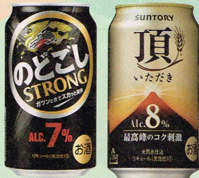
麒麟のどろし STRONG (リキュール(発泡性)) [キリンビール]

“ストロング系耐ハイ” 人気の影響を受けて登場したと思われる高アルコールビールは、ガツンとくる強烈な飲みごたえや、飲んだ時の満足度の高さが男性を中心に人気を呼んだ。今年に入り、大手4社全てが商品展開を行ったことで一躍社会現象に。