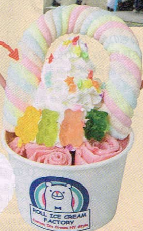
【ロールアイスクリームファクトリー 原宿・表参道本店】