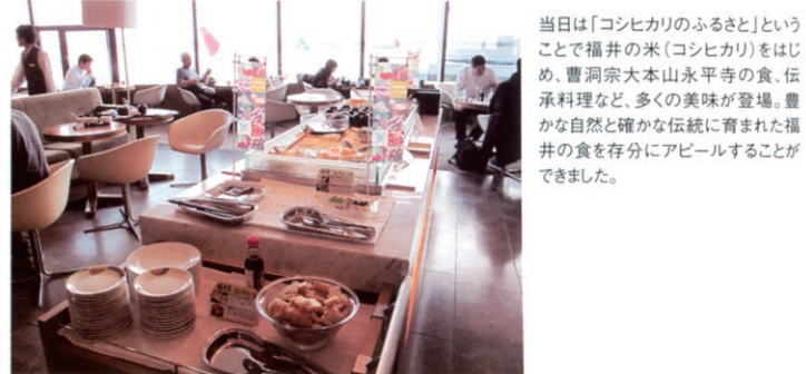
当日は「コシヒカリのふるさと」ということで福井の米(コシヒカリ)をはじめ、曹洞宗大本山永平寺の食、伝承料理など、多くの美味が登場。豊かな自然と確かな伝統に育まれた福井の食を存分にアピールすることができました。