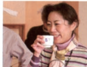
写真上は「加藤吉平商店」での見学風景。世界に誇る美酒に、参加者たちは酔いしていました。