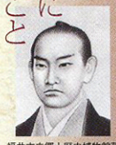
福井市立郷土歴史博物館蔵