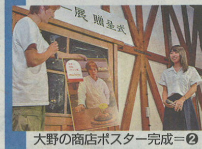
大野の商店ポスター完成=2