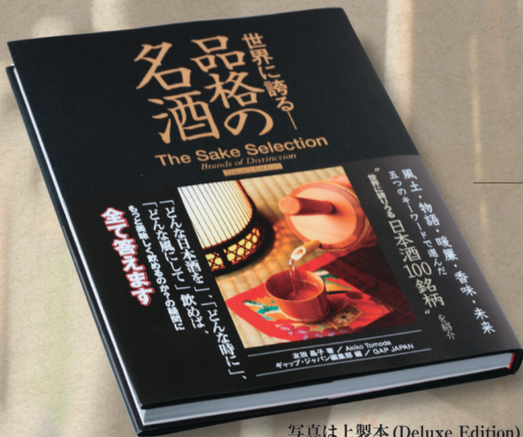
写真は上製本 (Deluxe Edition)

The Sake Selection Brands of Distinction